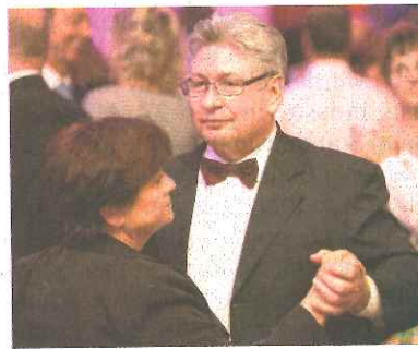
Die Preisträger der Sportlerehrung wurden Auszeichnungen und warmem Applaus bedacht. Die Musikgruppe „Simple Thing“ (links) animierte später viele Gäste, darunter auch Dessau-Roßlaus Oberbürgermeister Peter Kuras (rechts unten) zum Tanz im vollen Saal.