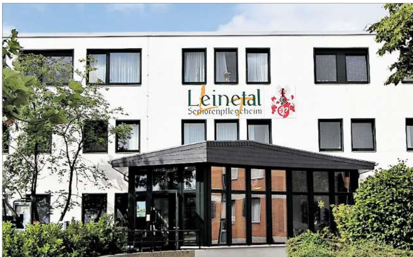
Die erste Adresse: Das Pflegeheim Leinetal wurde mit einer hervorragenden Pflegete ausgezeichnet.

Wer sich das Seniorenpflegeheim ausgesucht hat, der hat zweifelsohne eine sehr gute Wahl getroffen. Das Haus präsentiert sich Bewohnern und Besuchern als eine großzügige Einrichtung mit entsprechend geräumigen Zimmern, Aufenthaltsräumen, haus eigener Küche, einem Café, einem Park und Garten, der in der Region seinesgleichen sucht, und selbstverständlich mit einer hervorragenden Pflege (Pflegete 1,2).