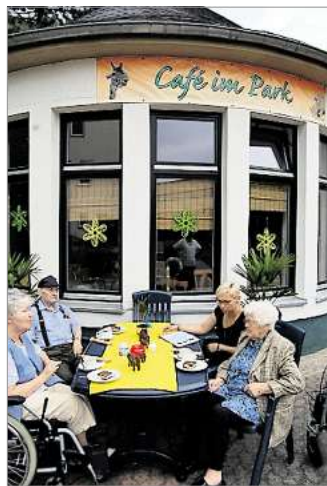
Das hauseigene Café bietet Platz zum Verweilen.

Demenz verläuft oft schleichend – starker Partner vor Ort nimmt die Angst vor Veränderung von Familienangehörigen im Alter