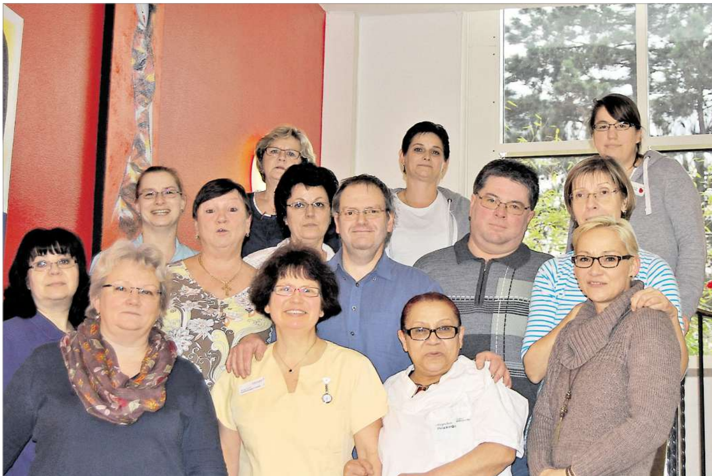
Kompetent und liebenswert: das Pflegeteam im Leinetal.

Wir alle sind früher oder später davon berührt, dass der Ehepartner, der Vater, die Mutter, die Großmutter oder der Großvater vergesslich werden, sich verändert zeigen. Erst heißt es, „man wird tüddelig und vergesslich“, dann diagnostizieren die Ärzte demenzielle Veränderungen bis hin zu einer schweren Demenz. Die Demenzerkrankung verläuft oft erst langsam und schleichend, dann werden immer schneller die Erinnerungen an das Hier und Jetzt geraubt. Erinnerungen an Kindheit, Hochzeit, Geburt der Kinder, aber auch Erinnerungen an den Tagesablauf, an ein bestimmtes Kuchenrezept werden von einem großen schwarzen Loch geschluckt.